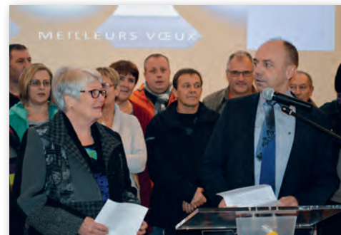
Les vœux des maires