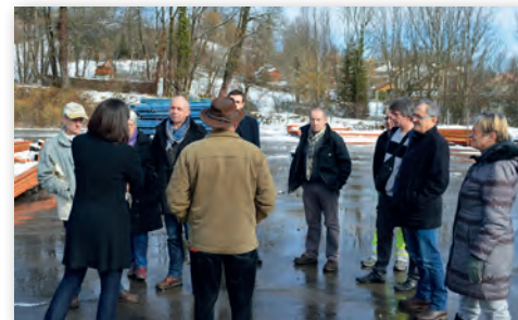
Les élus sur le terrain Smoby

Rempailleur : C. CASSAGRAND (occasionnel)