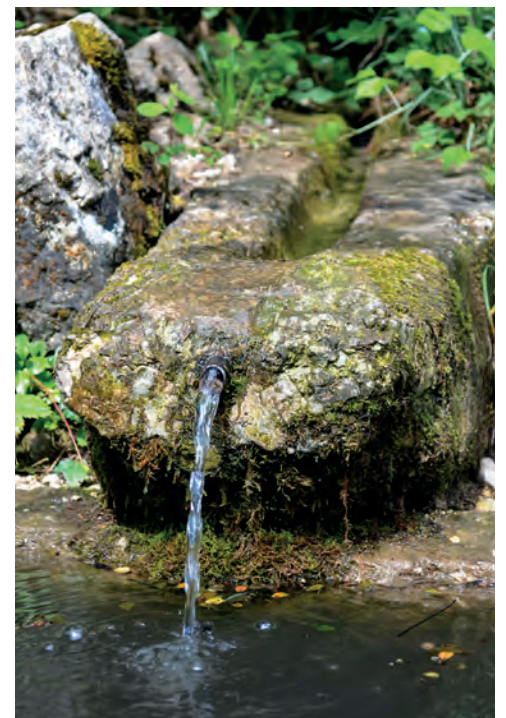
Fontaine de la Varesse