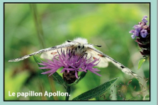
Le papillon Apollon

Classée Natura 2000 : bûis, pins et bouleaux seront vos fidèles compagnons tout au long de cette promenade à travers les pelouses sèches de la roche Lézan, ponctuée de beaux points de vue sur la vallée de la Bienne. Un sol peu épais, une exposition favorable au soleil, une faible capacité à retenir l'eau et la quasi-absence d'amendements : voici les principales caractéristiques des pelouses sèches, milieux très ouverts, appelés également pelouses à orchidées. La germandrée des montagnes, le thym serpolet et le sermontain sont quelques-unes des espèces floristiques qui accompagnent l'orchis mâle et l'orchis militaire dans ce milieu recherché par les papillons apollons. Elles possèdent un intérêt écologique unique : plus d'un quart des espèces protégées en France vivent sur des pelouses sèches. Elles sont aujourd'hui en forte régression dans une grande partie de l'Europe du fait de l'abandon des terres les plus difficiles à exploiter. Afin d'éviter leur embroussalement, le pâturage extensif est à maintenir.