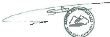
Ain-Pays des Lacs

Nous vous remercions de votre engagement à entretenir la bonne entente entre usagers de nos milieux aquatiques afin de faire perdurer puis développer les parcours de la pêche de la carpe de nuit.